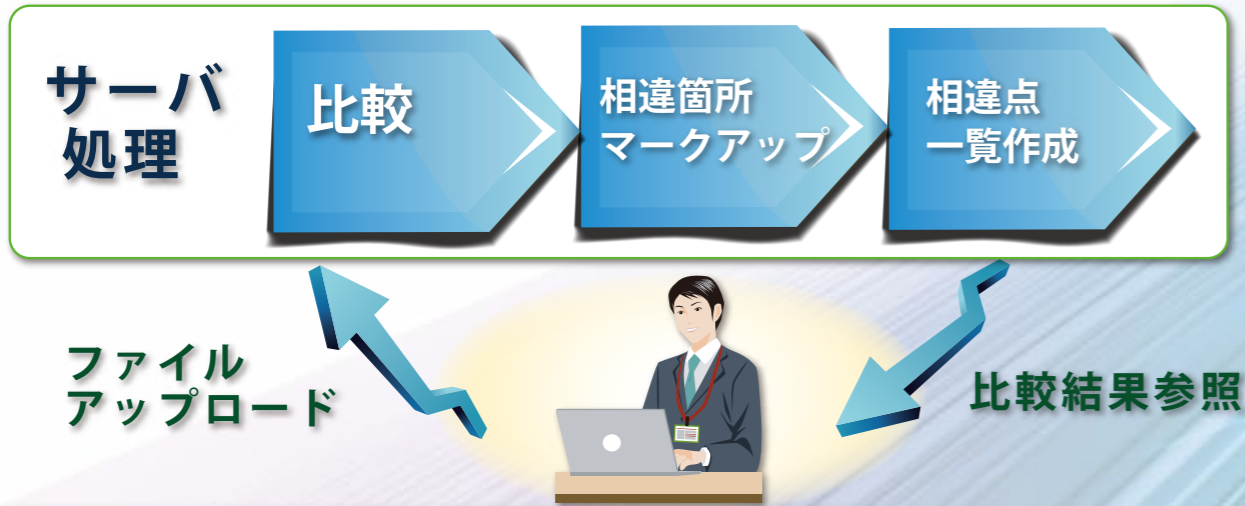
当社製品処理の概略図（データはサンプルです）