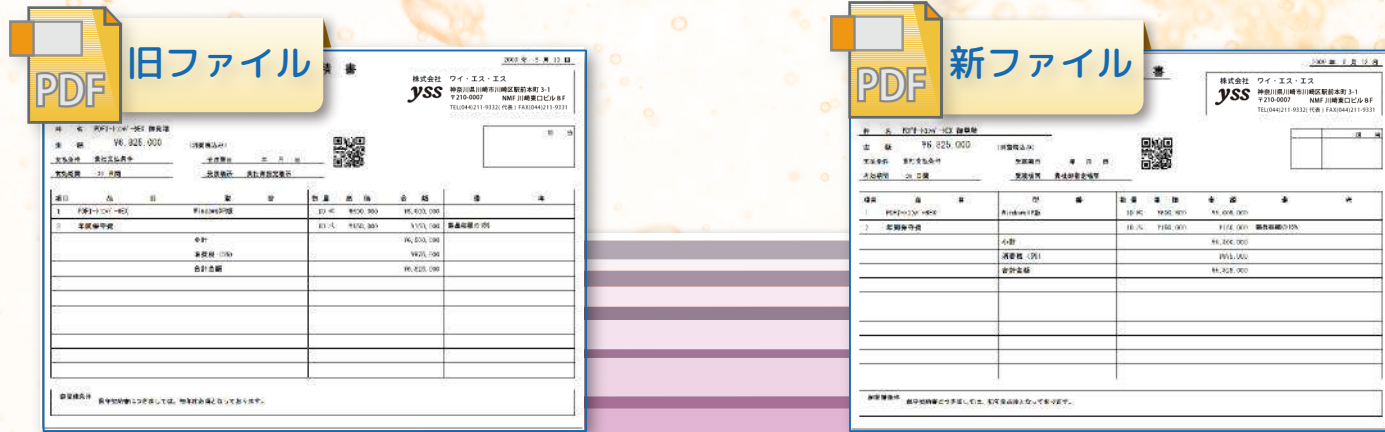
e 文章比較Helper 自動比較