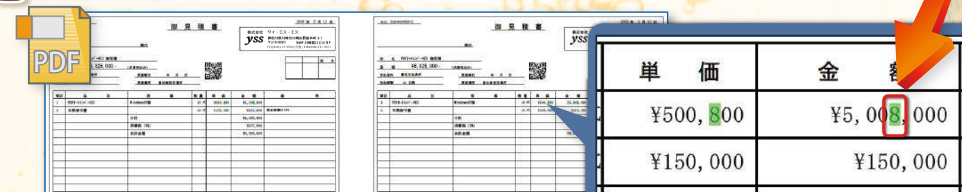
差異のある箇所（マークアップされた箇所）を確認